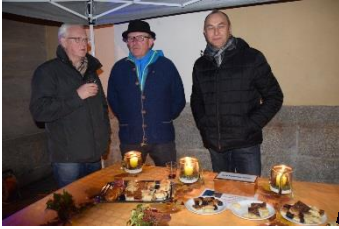
Weitere Bilder finden Sie auf unserer Homepage.